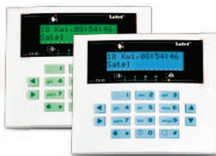
CA-10 KLCD-S / CA-10 BLUE-S