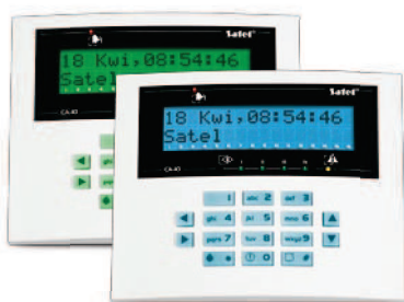
CA-10 KLCD-L / CA-10 BLUE-L