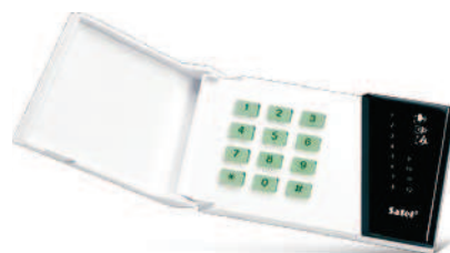
12 diod informujących o stanie wejść