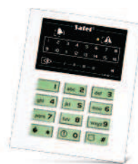
16 diod informujących o stanie wejść