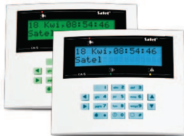
CA-5 KLCD-L / CA-5 BLUE-L