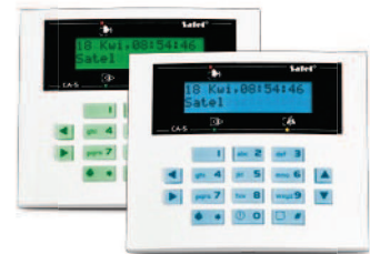
CA-5 KLCD-S / CA-5 BLUE-S