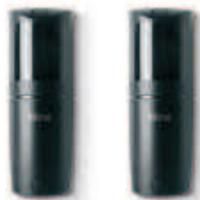
F210B fotokomórki (para) BLUEBUS, nastawne z kątem 210°, zasięg 15 m