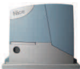
ROBUS350 siłownik z wbudowaną centralą sterującą BLUEBUS