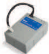
PS124 akumulator 24V 1.2 Ah z wbudowaną kartą ładowania