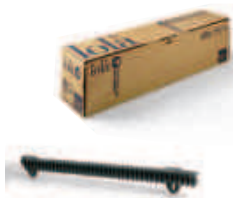
LOLA listwa zębata nylonowa M4, w odcinkach po 0,5 metra, pakowana po 10 sztuk, cena za 5 mb