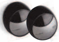
MOFB fotokomórki (para) BLUEBUS zasięg 15-30 m