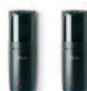
F210B fotokomórki (para) BLUEBUS , nastawne z kątem 210°, zasięg 15 m