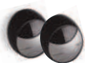
MOFB 1 komplet fotokomórek BLUEBUS