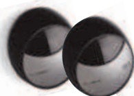
MOFB fotokomórki (para) BLUEBUS