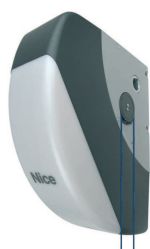
SOON siłownik 24V z wbudowaną centralą sterującą BLUEBUS