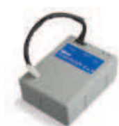
PS124 akumulator 24V 1.2 Ah z wbudowaną kartą ładowania

inne dodatkowe akcesoria - patrz strony 80 - 87