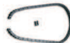
CRA4 łańcuch 5 m plus spinka do łańcucha