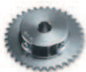
CRA6 koło zębate z 36 zębami