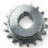
CRA7 koło zębate z 18 zębami