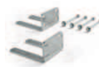
CRA8 dodatkowe uchwyty mocujące siłownik do ściany przy bocznym montażu - do bram rozsuwanych