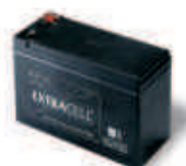
B12-B akumulator 12V 6.0 Ah