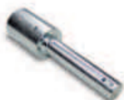
CRA9 adaptor do SUMO na wał: 1¼", 35mm, 40mm