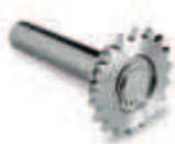
CRA1 koło zębate z 18 zębami plus wałek pośredni do SUMO/SOON

inne dodatkowe akcesoria - patrz strony 80 - 87